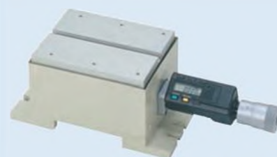
178-048 Нивелировочный стол D.A.T.