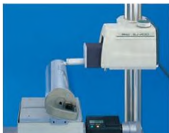
Измерение радиусной поверхности