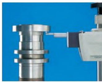
Измерение в перевернутом положении