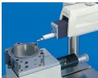
Измерение глубоких канавок