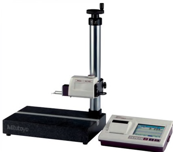
178-039 (на фото с SJ-411)